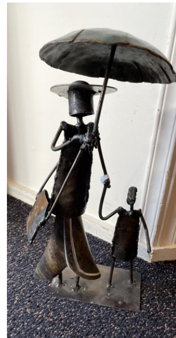
Vrouw met paraplu 38 cm hoog

Uit Zimbabwe komen deze leuke beelden gemaakt van steen en metaal.