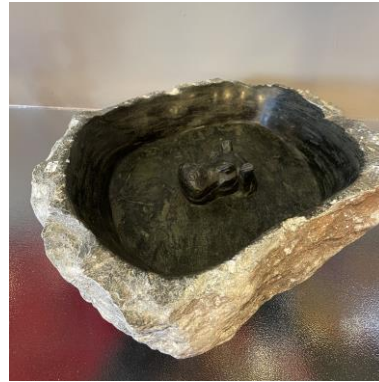
met nijlpaard 18 x 33 cm

Waterschalen van metaal op een voet of met een steker voor in de tuin uit Zimbabwe.