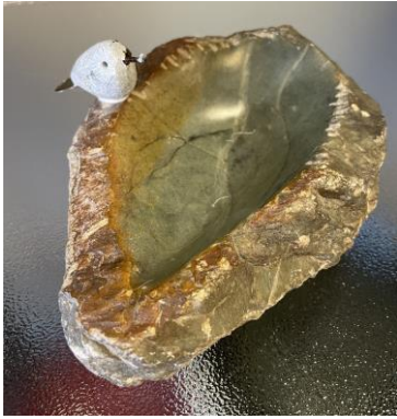
17 x 11 cm